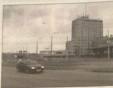
Frydlanckie Mosty w Ostrawie.

Rok 2002 zamknął rezultatem 3,380 mln ton węgla, który jest o 20 tys. ton lepszy od zaplanowanego. Natomiast biznesplan na rok bieżący zakłada wydobywanie 3,300 mln ton (na zakład „Łazy” przypada 2,395 mln, na „Dukle” w sąsiedniej Suchoj Dolnej 0,905 mln). Załoga liczyć będzie 4550 pracowników.