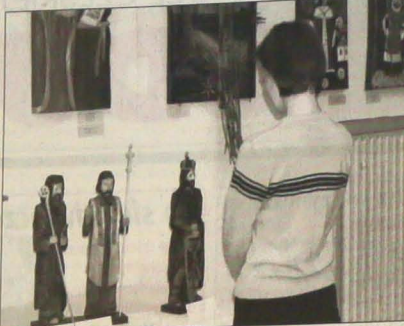
▲ Jeszcze dziś i jutro potrwa w czeskojęzyckiej „Strzelnicy” wystawa „Patroni Europy w sztuce”. Obejrząc można tu prace nagrodzone przez jury międzynarodowego konkursu plastycznego „Wódnik rzeźby Pawła Kufy z Mostów k. Jablonkova: święci Cyryl i Metody oraz św. Wacław. Jury przyznało zaofiarowanym twórcom z trzech miejsc. Wystawę można zwiedzać od godz. 8.00 do 16.00.