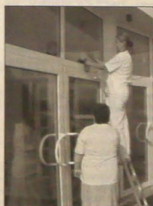
▲ Ostatnie przygotowania przez oficjalnym otwarciem drzwi.