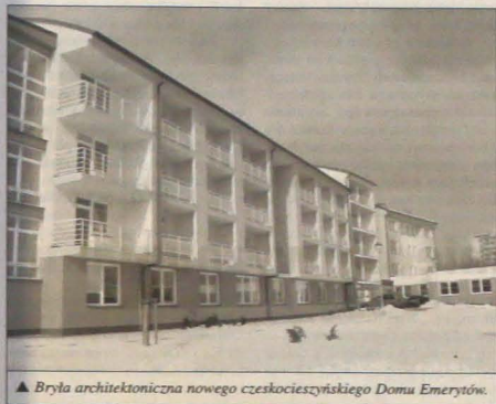
▲ Bryła architektoniczna nowego czeskosłowackiego Domu Emerytów.

W NOWEJ PLACÓWCE MIEJSCE DLA 72 SENIORÓW