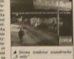
Strona tytułowa soundtracku „8 mile”