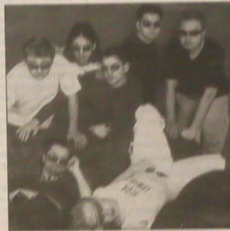
mu do głowy, iż moglibyśmy ich zaprosić. W końcu trasa była rewelacyjna i jestem bardzo szczęśliwy, bo znalazłem wielkich przyjaciół. Do dziś jesteśmy w kontakcie.

Wiesz nie mówię się. Z jednego teledysku się nie należy również się wystrzeżać to podobnie. Dziękujemy za rozmowę.