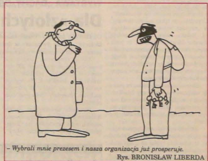
- Wybraли mnie prezesem i nasza organizacja już prosperuje. Rys. BRONISŁAW LIBERDA

NIEDZIELA, PONIEDZIAŁEK - Zachmurzenie umiarkowane przechodzące w poniedziałek do dużego, możliwe opady śniegu. Nadal chłodno, ale bez ekstremów. Spodziewane są temperatury od -6 do 1 st. C.