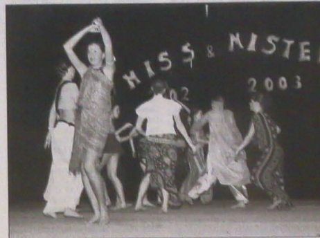
6 grudnia dziewcząt klas 6-8 i rodziców na szkolny finał wyborów „Miss & Mister Show”...

Czeskokiszyńska PSP przy ul. Havlíčka jest - obok jablonkowskiej szkoły im. H. Sienkiewicza - największą z zaolziańskich polskich podstawówek. Choćaj niniejszy tekst powstał jeszcze przed tegorocznymi zapisami do klasy pierwszej, które przebiegły w środę 5 lutego br., było już jednak wiadomo, że brakiem dzieci dyrekcyjnie nie będzie musiała się martwić.