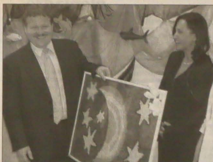
▲ „Abyście, panie ministrze, byli wybitni wsmioci jako tym miesiönce” - powiedziała jedna z mieszkanek Domu Pomocy Społecznej w Trzyniecu-Sosnie ministrów pracy i spraw społecznych RC Zdeněkowi Škromachowi w czasie przekazania upominku wykonanego przez pensjonariuszy DPS. Na zdjęciu Z. Škromach ogląda upominek wspólnie z wiceburmistrzynią Trzynieca Wřę Pulkowską.

Czy historia powtórzy się również w Karwinie? Jak długo będą supermarket utrzymywać ceny na stosunkowo niskim poziomie? I czy tylko będą robić to do momentu, zanim na tyle uzmocnią swoje pozycje na miejscowym rynku, by ponownie pozwolił im wyfrunąć w górę? (sch)