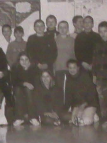
siedzbą do dnia dzisiejszego. Na pewno uczymy urodziny szkoły uroczystą akademią, czy jednak odbędzie się ona w roku przyszłym, czy aż w roku następnym, dopiero ustalimy.”