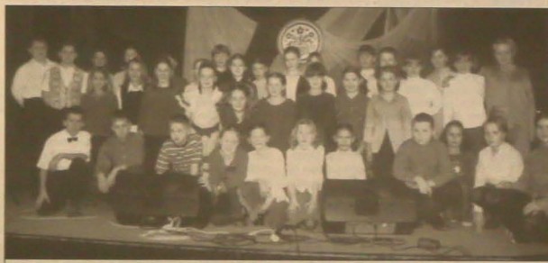
▲ Uczestnicy II kategorii eliminacji do FPD zrobili sobie wspólne zdjęcie.

Do finału VIII Festiwalu Piosenki Dziecięcej, który odbędzie się 3 marca w Domu Kultury Petra Bermana w Hawierzowie, zakwalifikowało się w kategorii solistów 17 uczniów; w kat. duetów - duety z Trzyčicy V. Gnojnika i Karwiny-Nowego Miasta; zespołów - zespoły z Błędowa, Karwiny-Nowego Miasta i Bystrzycy.