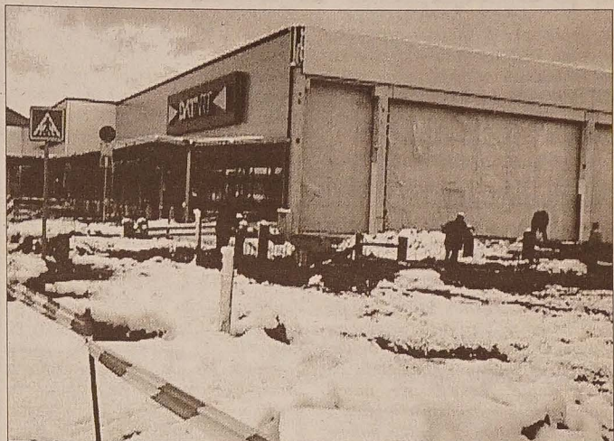
Atak zimy nie przerwał robót na placu budowy w Avion Shopping Parku w Ostrawie Zabrzegu.

Wystawy TEATR CIESZYŃSKI - WIELKA GALERIA: do 5. 12. wystawa B. Kowalczyk, B. Szczuki, A. Papiły i D. Krygiel. Otwarte po-pt: 9-15. SALA WYSTAWOWA MANESA, DK Karwinia: do 26. 11. jubileuszowa wystawa Oskara Pawłasa. Otwarte wt-pt: 9-17, so: 14-18, nie: 10-16.