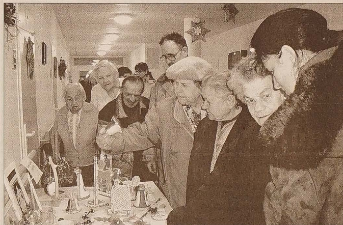
Prace pensjonariuszy domów opieki społecznej wzbudziły szczerze zainteresowanie publiczności.