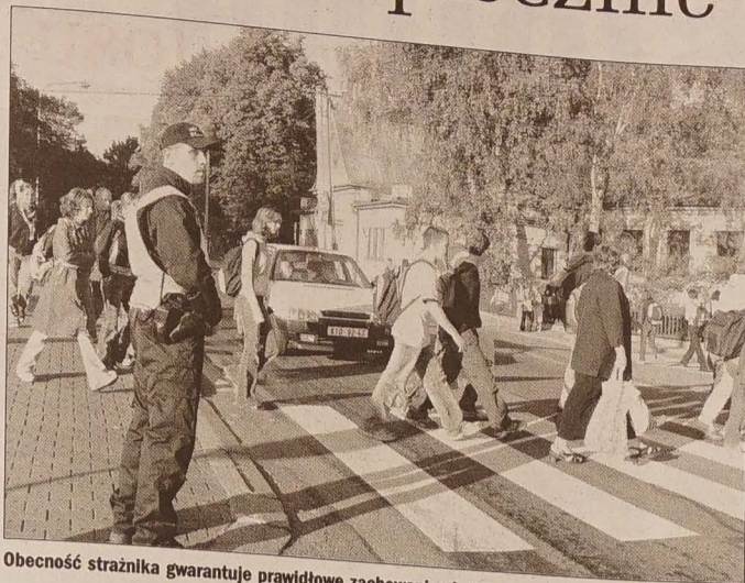
Obecność strażnika gwarantuje prawidłowe zachowanie się kierowców i przechodzących dzieci.