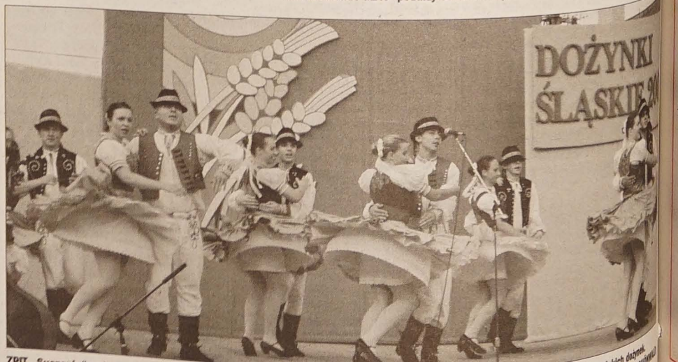
ZPIT „Suszanle” wykonał tańce słowackie wręcz po mistrzowsku, za co wystużył sobie gromkie brawa uczestników błędwickich dożynek.