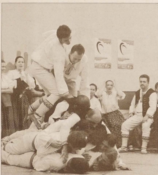
Obzęd „szkubania pierza” członkowie zespołu „Oldrychowice” zakończyli żywą piramidą.