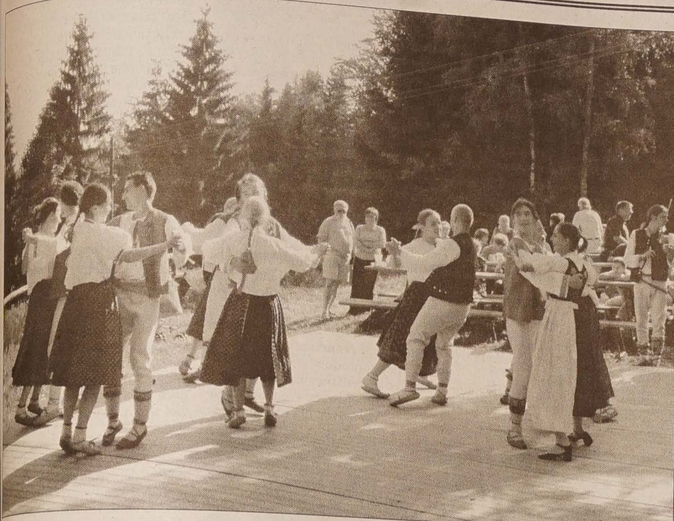
MACIERZAŃSKI FESTYN NA BAGIŃCU PO RAZ ÓSMY

tel.: 558 731 766 faks: 558 740 044 info@glosludu.cz