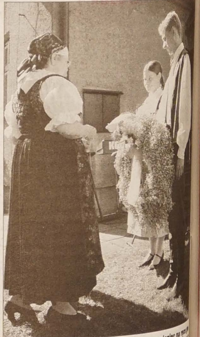
Siatkówka i ringo to tradycyjne gry Festynu Górskiego w Koszarzyskach. Przdownicy przekazują symboliczny dożynkowy wieniec na pętlę podarzy Suskich Dożynek.