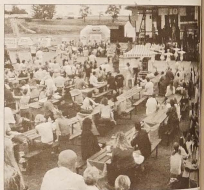
Już 10 lat trwa współpraca Piotrowic i Godowa. Po południu w teatrze, gdzie odbywał się jubileuszowy festyn, można było znaleźć miejsce, ale wieczorem pękali w szwach.