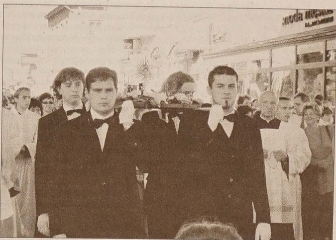
Wierni w Cieszynie nieśli w niedzielnej procesji relikwie św. Melchiora.

Dyrekcja zamierza ponadto otworzyć 1 września 2005 r. w szkole 4-letnie liceum techniczne.