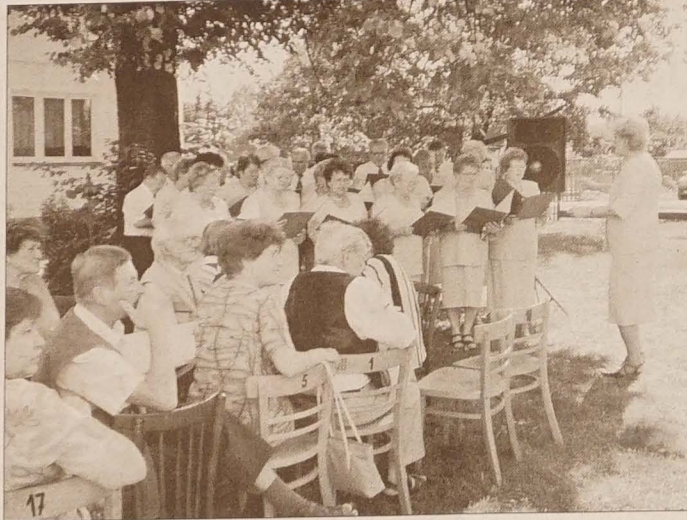
Chór mieszany „Sucha” potrafił publiczność nie tylko zachwycić, ale i rozbawić do łez.

Niesygnowane materiały publicystyczne i informacyjne pochodzą z internetowych serwisów informacyjnych.