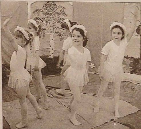
▲ „Brzydkie kaczątko, brzydkie kaczątko, jak w waszym stadzie mogłoby być, brzydkie kaczątko nie może przecież ląbędzy być...” ▼ Hurra! Dobrze! Miły do szczęśliwego końca. Kaczątko okazało się ląbędziem.