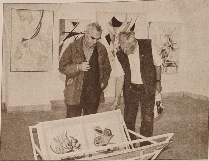
Miłośników czeskiej sztuki awangardowej 2. połowy XX wieku i nie tylko na pewno zaciekawia wystawa w Galerii Zamkowej „Chagall” w Karwinie Frysztalce. Do 4 lipca oglądać tu można twórczość Vladimíra Vašíčka, zmarłego w ub. roku malarza pochodzącego z Moraw Południowych. Wystawa przedstawia przekrój jego twórczości od początkowych prac figuralnych i krajobrazów z lat 50. ub. wieku po czystą abstrakcję.

Niesygnowane materiały publicystyczne i informacyjne pochodzą z internetowych serwisów informacyjnych.