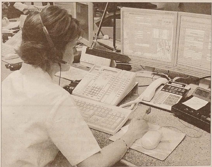
Jedno ze stanowisk dyspozytorni ostrawskiego centrum zintegrowanego systemu ratunkowego.

Użytkownicy się od początku lat 90. niż demograficzny sprawił, że w 1996 r. zamknięto czeskie przedszkole w Darkowie, w 1997 r. w Starym Mieście, a w dwa lata później w jednym przedszkolu na Granicach i w Fryszacie. Nie ma już też czeskiego przedszkola przy ul. Leona – rok temu otwarto tu Dom Opieki Społecznej. Obecnie w Karwinie funkcjonuje jedno czeskie przedszkole posiadające osobowość prawną.