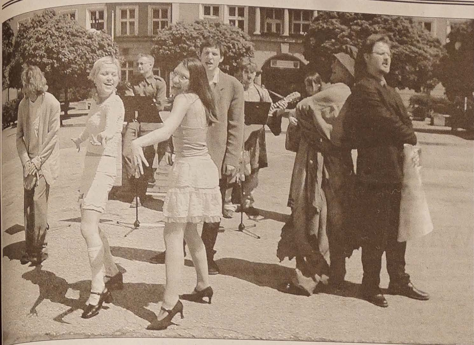
Występy teatrów ulicznych (na zdjęciu sprzed czeskokoczińskiego ratusza zespół prowadzony przez studentów z brneńskiej Wyższej Uczelni Teatralnej) przypominały wczoraj cieszyńnikom, że w maju rozpoczyna się XV Międzynarodowy Festiwal Teatralny „Bez granic”. W pierwszym dniu festiwalu odbędzie się pod patronatem ministrów kultury RC, Polski i Słowacji, festiwalowe spektakle zaprezentowały m.in. krakowski Narodowy Teatr Stary czy praskie „Dejvícké divadlo”.

tel.: 558 731 766 faks: 558 740 044 info@glosludu.cz