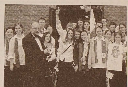
W chwilę po ogłoszeniu wyników.