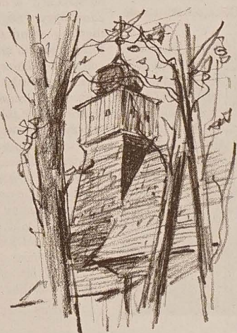
Zabytkowy kościółek drewniany w Markłowicach.