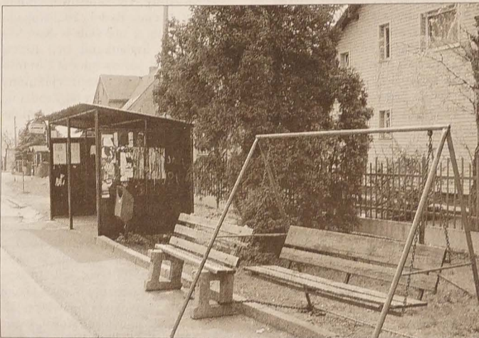
Oto przykład wyjątkowej dbałości o Klienta. Na jednym z przystanków w Orłowej pasażerowie mogą sobie umilić czekanie na autobus, bujając się na huśtawce.

UE. Zaprezentowane są wszystkie kraje członkowskie, waluty, sposoby ich przeliczania na euro, a także... dowcipy. Organizatorzy zadbali o rozwiązania często pojawiających się euronimów. Dementują zatem pogłoski jakoby w Unii zabroniona miała być sprzedaż krzywych bananów, że truskawki powinny być owalne, a specjalna komisja ustali grubość i średnicę pizzy... Zwiedzający mogą dowiedzieć się np., że patronami Unii są św. Teresa i Brygida, a także św. Katarzyna czy Cyryl i Metody. Wiedza o UE serwowana jest tutaj w bardzo lekkiej i przystępnej formie!