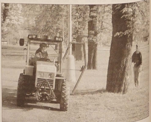
Trwa opryskiwanie kory kasztanowców i otaczającej ich ziemi. Ciekawe, czy środek chemicy „Karate” da sobie radę ze szrotówkiem kasztanowcowiawczykiem?

U nas, np. w Cz. Cieszynie, przeprowadzono asenację kasztanowców. Opryskano korę i otoczenie drzew w Alei Swojsika. Jest więc nadzieja, że te piękne drzewa nie znikną z naszego krajobrazu i w dobrej kondycji towarzyszyć będą następnym pokoleniom mieszkańców tej ziemi.