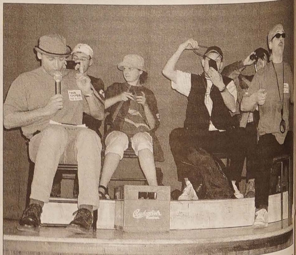
Teatrzyk APROPO przedstawia: wycieczka autokarowa wyrusza w kierunku Czeskiego Cieszyńska.

Dokończenie ze str. 1 W konkursie TELE - FORTUNA można było zyskać CD Kawiarni Avion albo miódulę. Po wspaniałej uczcie parodii i satyry okorzenionej odrobina melancholii poetyckiej, kontynuowano spotkanie giełdą wrażeń, plotek, pomysłów i marzeń... A marzy się wszystkim kolejna taka APROPna impreza! Może za rok... (bag)