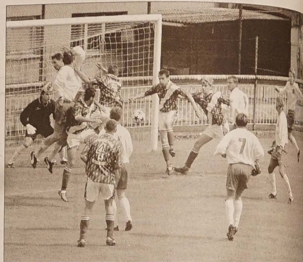
Groźna sytuacja w polu karnym Frydku-Mistku.