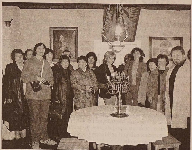
W tym miejscu zrodził się pomysł Weseła Wyspiańskiego. Grupa nauczycieli podczas zwiedzania Rydlówki w Bronowicach.