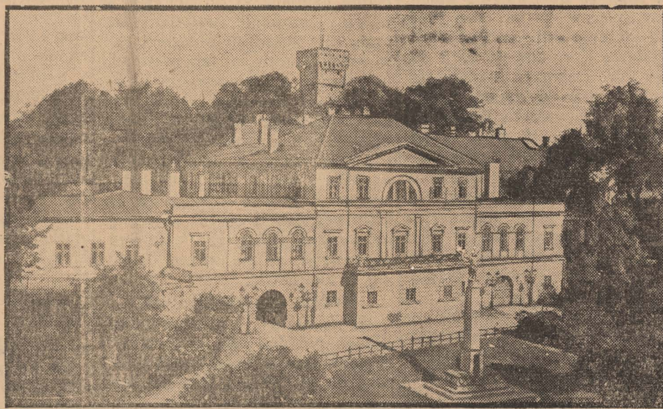
Góra zamkowa z wieżą Piastów w Cieszynie

sem prześladowania ze strony Czechów. W oparciu o Rzeczpospolitą Polską będziemy umieli wywalczyć ochronę dla naszych świętych praw.