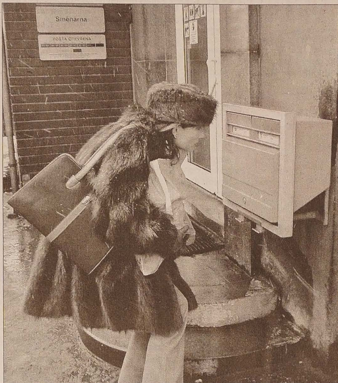
Tu można się dowiedzieć, kiedy poczta opróżni skrzynkę na listy. Gdzie jednak stwierdzimy, kiedy nasz list dotrze do adresata? Zdjęcie ilustracyjne MAREK SANTARIUS

Informuję - czytamy w liście starosty - że Poczta Polska w celu dostosowania się do wymogów zawartych w Dyrektywie Unii Europejskiej oraz do trendów panujących w krajach Unii Europejskiej, wprowadziła od dnia 1 lipca 2002 r. system podziału przesyłek listowych ze względu na prędkość opracowania i ich doręczenia. Wspomniana kategorizacja doty-