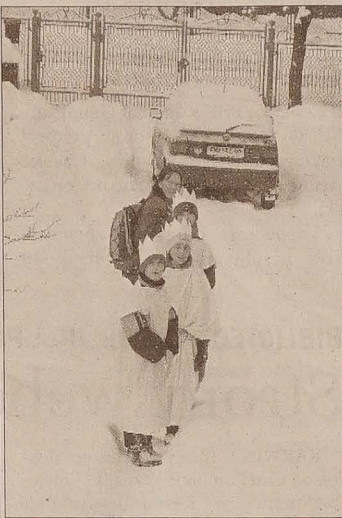
▲ Trzej królowie kwestujący w ramach tegorocznej kwesty Caritasu na Podbeskidziu brodzili w śnieżnych zaspach. W poszczególnych domach witano ich z gorącym sercem nie szczędząc datków dla potrzebujących w kraju i za granicą. Przebierańcy odwiedzali się wierszami i kołędami. Wysłannicy jabłonkowskiego Caritasu wypisywali również na odrzwiach poświęconą krędką tradycyjny symbol trzech króli: K+M+B 2004.