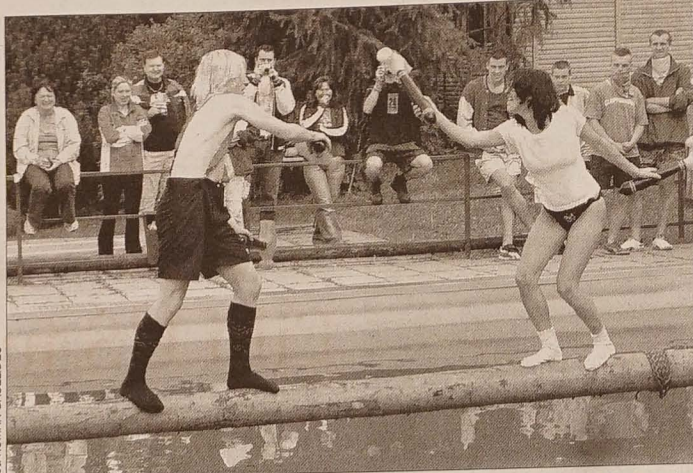
Najbardziej widowiskową dyscypliną był pojedynek na kłodzie. Zawodnicy „lali” się dmuchanymi młotami, po czym brali kąpiel w chłodnej wodzie.

Niesygnowane materiały publicystyczne i informacyjne pochodzą z internetowych serwisów informacyjnych.