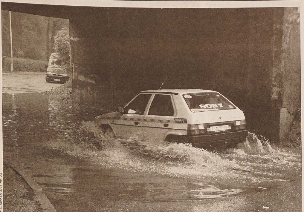
Woda poniekąd utrudniła przejazd pod wiaduktem do Alei Masaryka w Czeskim Cieszynie.

Wystawę, której organizatorem jest Komitet Miejski PZKO w Hawierzowie, można zwiedzać do 17 września.