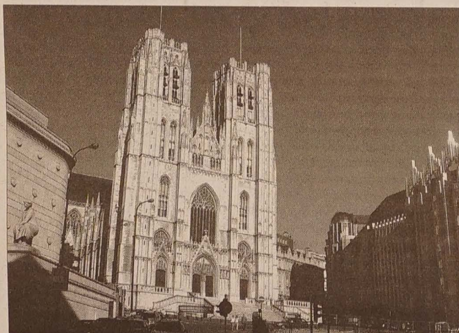
Katedra św. Michała – koronkowe zwieńczenie dwóch wież niczym w paryskiej Notre Dame. Wnętrze uderza jasnością i brakiem surowości – tak znanej z naszych gotyckich kościołów.

Zbyt dużo „atrakcji” w jednym miejscu... Choć kelnerzy po waleniach (to jest quasi-francusku) i angielsku ochoczo zapraszają do zajęcia miejsca za małymi stoliczkami i skosztowania kuchni rodzimej – walońskiej bądź flamandzkiej. Dwie wersje gastro-