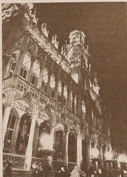
Dopiero reflektory wydobywają z aksamitu nocy złocenia kamieniczek na rynku.

ma trzy części – Galerię Królewską, Królowej oraz Księżycą. Jest w nim pełno księgarni, butików, perfumerii, kawiarni (w tym i ruska), sklepów z czekoladą i pralinkami, nawet jak słynny sklep Neuhaus, który otwarty jest tu od XIX w.