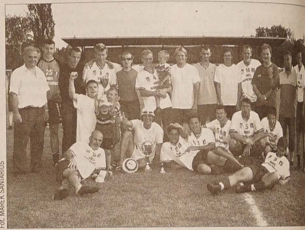
Zwycięska drużyna Banika Olbrachcice.

WYNIKI – grupa A: Lesní Albrechtice – Albrechtice nad Orlicí 0:2 (Strnad 2), Banik Olbrachcice – Albrechtice u Lanškrouna 1:0 (Jilek), Albrechtice u Lanškrouna – Albrechtice nad Orlicí 0:1 (Velišek), Banik Olbrachcice – Lesní Albrechtice 4:0 (Goj, Hric, Kadeřábek, Hekera), Lesní Albrechtice