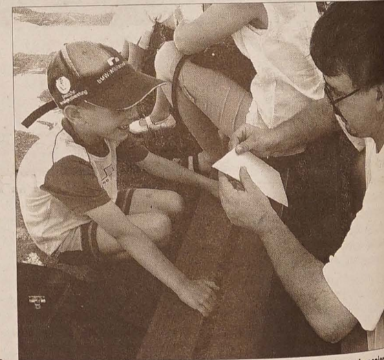
Ojcowie musieli wykazać się nie lada sprawnościami, np. w składaniu paplających lotów.