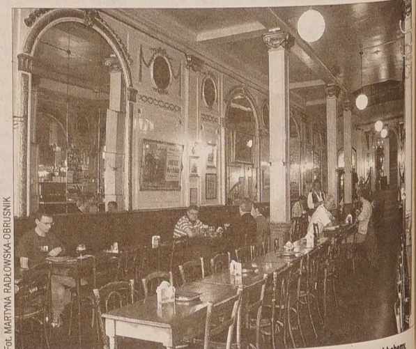
Kawiarnia „Nagła śmierć” – bardzo brukselskie miejsce, centrum tutejszej bohemy.