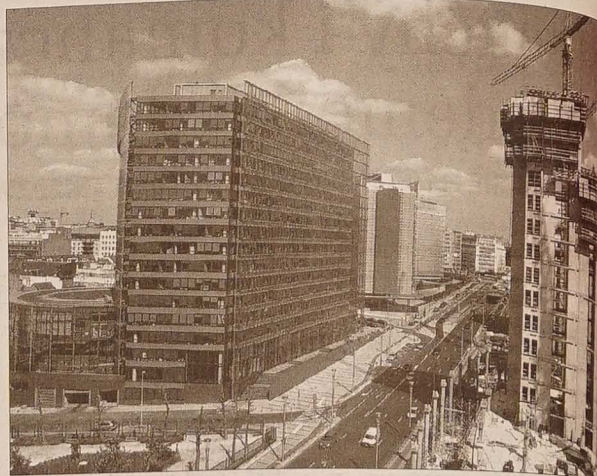
Unia „kolonizuje” coraz to nowe potacie miasta. Buduje się w górę i w dół. Tu widoczna unijna dzielnica – po prawej bryła „urzędu spraw zagranicznych” w głębi gmach Komisji Europejskiej.

Trzeba przełamać całą niechęć i pokonać betonowy wał. Sowiecie się to oplaci, gdyż na horyzoncie już widać wejście do pasaży Świętego Huberta. Galeria – bo tak się tu o niej mówi – dzierży palmę europejskiego pierwszeństwa z 1846 roku, czyli momentu, gdy wybudowano i przeszklono 200-metrowy pasaż handlowy. Pasaż