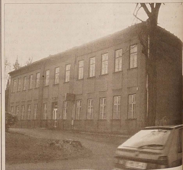
Budynek byłej polskiej szkoły w łyżbicach nie zmienił się zbytnio od ostatniej fotografii z 1903 r.