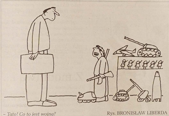
- Tato! Co to jest wojna? Rys. BRONISŁAW LIBERDA