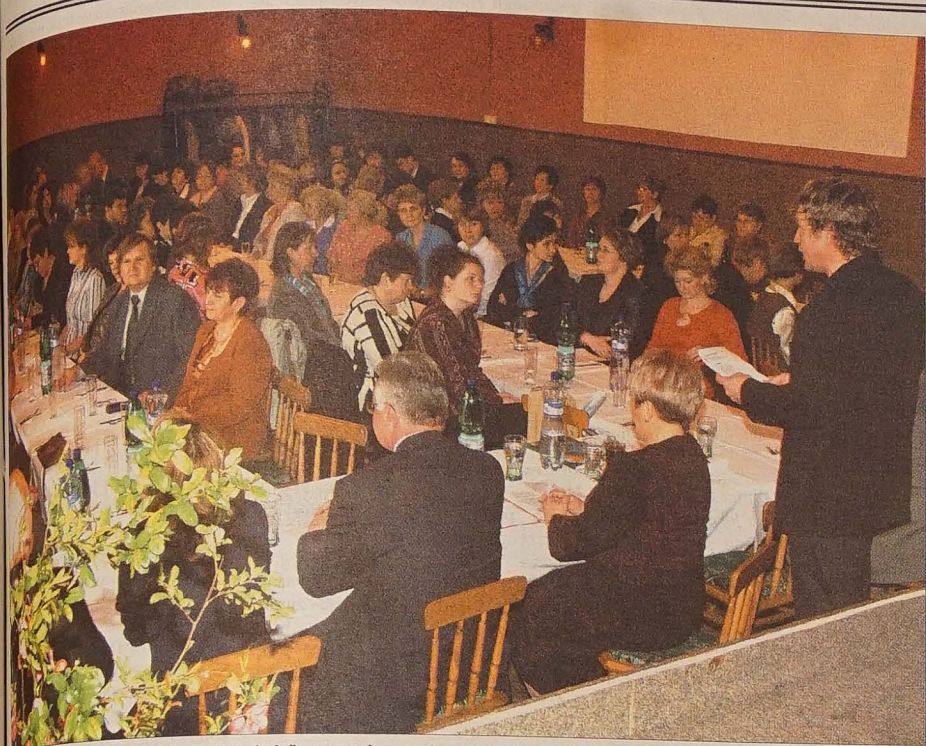
W czeskojęzycznej restauracji „Na Brandysie” rozpoczęły się wczoraj po południu obrady Komitetu Nauki i Kultury w RC. Impreza zakończyła się po zamknięciu numeru, do tematu powrócimy więc we wtorek.

SOBOTA 7 MAJA 2005 NR 54 ROCZNIK LX CENA 6 Kč tel.: 558 731 766 faks: 558 740 044 info@glosludu.cz