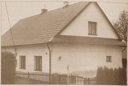
Tak przedstawia się obecnie budynek byłej polskiej szkoły w Zawadzie.