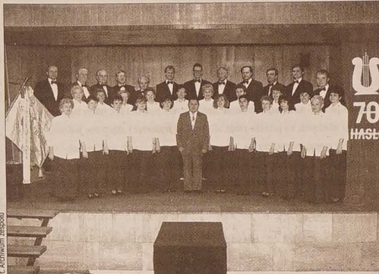
Chór mieszany „Hasło” podczas obchodów 70-lecia.

Wedrynia (17) - ODS (2), KDU-ČSL (2), SNK Vendryně (8), „Wspólnota” (5)