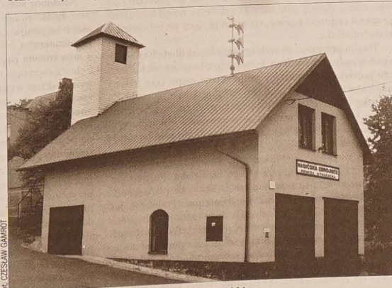
Obecna remiza strażacka w Bukowcu pochodzi z 1931 r.