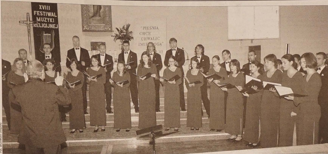
„Canticum Novum” przedstawiło rumskiej publiczności zaolziański sposób interpretacji pieśni religijnych.