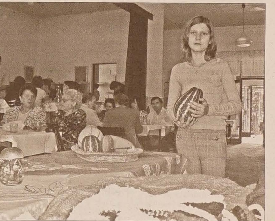
Na bogumińskim spotkaniu jesiennym.