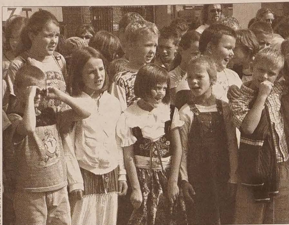
Na cieszyńskim rynku spotkało się w ubiegły piątek blisko 600 dzieci na wspólnym śpiewaniu pieśni regionalnych.

Niesygnowane materiały publicystyczne i informacyjne pochodzą z internetowych serwisów informacyjnych.