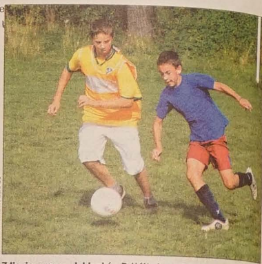
Zdjęcie z meczu Jabłonków B (żółte koszulki) - Gnojnik (8:0).

W Y N I K I ELIMINACJI W POWIECIE FRYDECKO-MISTECKIM: 1. PSP Jabłonków A (13 pkt.), 2. PSP Wędrynia