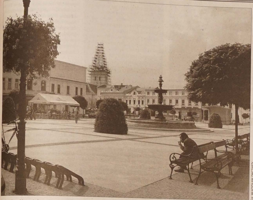
Barzo niezwykły wygląd przedstawia w ostatnim okresie jedna z dominant fryszackiego rynku – wieża kościoła p.w. Podniesienia Krzyża Św. Od 20 lipca pracują na niej ludzie z firmy „H&B delta”. Ich pierwotnym zadaniem była wymiana starego blaszanego poszycia na nowe-miedziane. Choć pogoda sprzyja i prace przebiegają sprawnie, listopadowy termin dokończenia robót może ulec wydużeniu. Powód? Niespodziewana konieczność wymiany stalowych belek konstrukcji więzania dachowego.

CZWARTEK 21 WRZEŚNIA 2006 NR 112 ROCZNIK LXI CENA 6 KČ tel.: 558 731 766 faks: 558 740 044 info@glosludu.cz