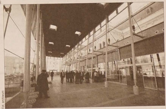
Nowa hala dworcowa w Świnowie.

ron. Tym razem kobieta miała szczęście. Chłopców uciekających z miejsca zdarzenia zatrzymali strażnicy i ich łup wrócił do właścicieli. Do karwińskich strażników zgłosiło się już także kilka osób, którym na kąpielisku skradziono telefon komórkowy. Kilkanaście kradzieży zgłosił letniczy, który wypoczywał nad kąpieliskiem w Ostrawie Wrzesinie. – Duża przestrzeń, mnóstwo ludzi, nieuwaga, to wszystko sprzyja złodziejom – twierdzi Soňa