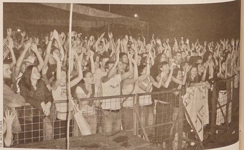
Złotowa publiczność – jak zwykle – bawiła się wspaniale.