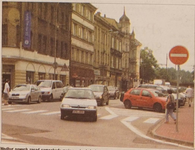
Według nowych zasad samochody można ustawiać nie tylko wzdłuż chodnika, ale również poprzecznie przy dotrzymaniu zasady, że powinien pozostać wolny pas jezdni o szerokości minimum 3 m.