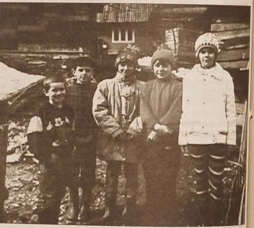
Ukraińskie dzieci objęte „Adopcją Serca”.

nieg postaw uczniów. Wspólne działania i wspólny cel wyklucza niezdrową atmosferę. Uczniowie mobilizują się nawzajem do wielu pozytywnych działań, przypominają o wpłacaniu składek. Uczą się odpowiedzialności i odpowiedzialności, nie chwiliowo związanej z jakimś krótko trwającym