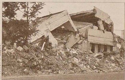
Podobne widoki nie należą do rzadkości nawet na potencjalnie spokojnych terytoriach Izraela w Kotlinie Jordana.