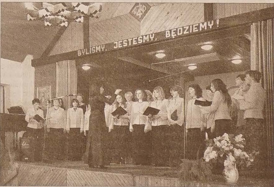
W ramach projektu „Melodia Beskyd” odbył się w maju koncert chóru i jego gości w największym Domu PZKO.

Projekt jest dobrym przykładem na to, jak rzeczywista potrzeba i długoletnia działalność mogą być źródłem nowych kontaktów i jak można wspomagać autentyczną współpracę transgraniczną.