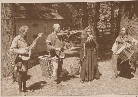
Wiele oklasków zebrali grajkowie i śpiewacy z praskiego zespołu „Dubia Fortuna” – pasjonaci muzyki średniowiecznej i renesansowej.

Niesygnowane materiały publicystyczne i informacyjne pochodzą z internetowych serwisów informacyjnych.