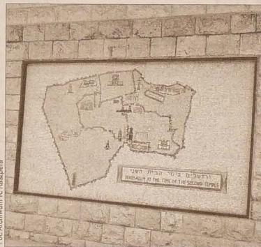
Mapa Jerolimy z czasów drugiej świątyni.

Wojska krajów sąsiednich atakowały z południa, wschodu i północy, a jedynie zachód, Morze Śródziemne oraz niebo były otwarte. Izrael poddał atakom, zwycięstwo nie było jednak pełne; wstrzymanie ognia nie zakończyło się układem pokojowym, a linie frontowe nie stały się granicami, lecz w rozdzielonej barykadami i zasiekami z drutu kolczastego Jerolimskie przebiegały nawet ulicami. Ten