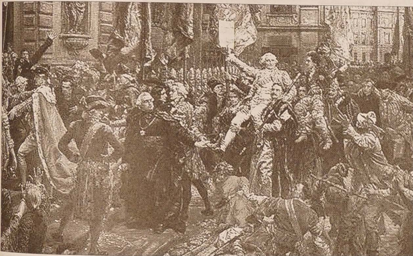
Jan Matejko, „Konstytucja 3 maja 1791 roku”

Jesteśmy pod wrażeniem, pełni podziwu dla wykonawców i organizatorów, impreza była prawdziwym balsamem dla duszy – to tylko kilka spontanicznych wypowiedzi ludzi siedzących na widowni.