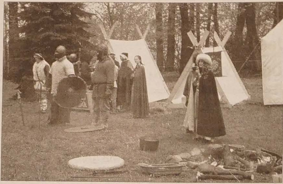
W osadzie starosłowińskiej na Wzgórzu Zamkowym można było podczas długiego majowego weekendu oglądać także walki toczone przez wojów słowiańskich.