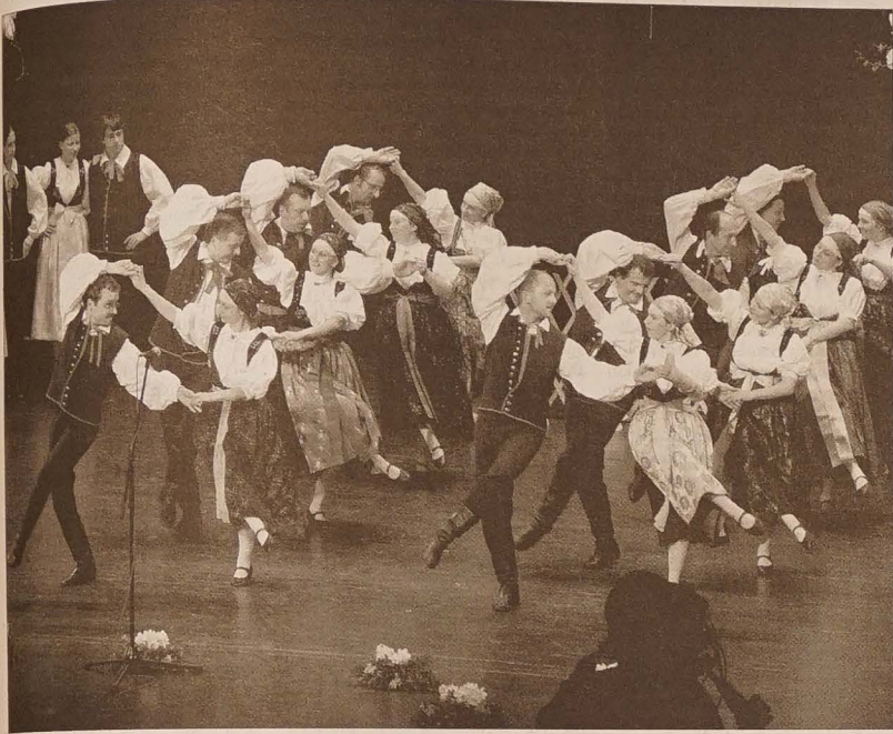
Największa grupa taneczna z Błędowic – były Zespół Regionalny „Błędowice” podczas sobotniej premiery w Domu Kultury im. P. Bezruca w Hawierzowie.

tel.: 558 731 766 faks: 558 740 044 info@glosludu.cz