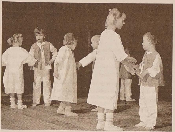
Program mosteckiego „Popołudnia z folklorem” otworzyli wzruszającą wiązaną tańców śląskich i góralskich dzieci z miejscowego przedszkola.

Tu warto wspomnieć o poprzedzającej święto dacie 2 maja. Ten dzień jest obchodzony w Polsce jako Dzień Flagi Rzeczypospolitej Polskiej – Sejm postanowił tak w lutym 2004 r. Jednocześnie 2 maja obchodzony jest także Dzień Polonii i Polaków za Granicą. Opr. JACEK SIKORA