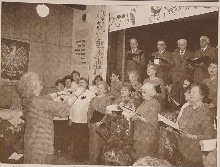
Koncert jubileuszowy nieborowski „Zgoda” zakończyła - wraz z przyjaciółmi z zespołu „Godulan-Ropica” - „Oda do radości” Ludwika van Beethovena.