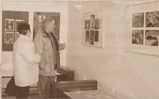
Grupa amatorskich fotografików, która założyła Stowarzyszenie Fotograficznych Dyletantów przedstawia w Bibliotece Regionalnej na rynku Masaryka w Karwinie Fryzjacje pion swich pocznian. Trzeba zauważyć, że wystawa cieszy się dużym powodzeniem. Swoje inicjatywy nie ogranicza do fotografowania, gdyż wielu jej członków jest plastykami, a na werniszu w happeningowym przedstawieniu zamieniali nie tylko poczucie humoru, ale też literacki talent.

■ Niesygnowane materiały publicystyczne i informacyjne pochodzą z Internetowych serwisów informacyjnych.