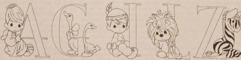
Literka A jak anioł. Literka G jak gęś. Literka I jak Indianin. Literka L jak lew. Literka Z jak zebra.

NASZ ADRES: Redakcja Głosu Ludu, Komenského 4, 737 01 Český Těšín. Pisząc do nas podaj swój wiek, klasę i adres szkoły, do której uczęszczasz. Korespondencję przysłać można także pod e-mail: info@glosludu.cz a w załączniku dopisać Głosik.