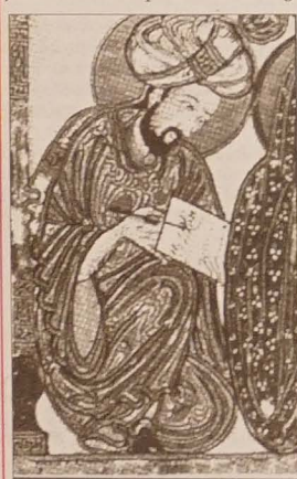
Arabski pisarz ze starej ryciny.

W miarę upływu czasu coraz bardziej rozwijał się ludzki język. Ludzie mogli się lepiej ze sobą porozumiewać, zaczęli też szukać lepszych sposobów zanotowania swoich słów i myśli. Nie używali już obrazków, ale pisma obrazkowego. Tak było między innymi w starożytnym Egipcie. Egipskie pismo obrazkowe nazywamy hieroglifami.