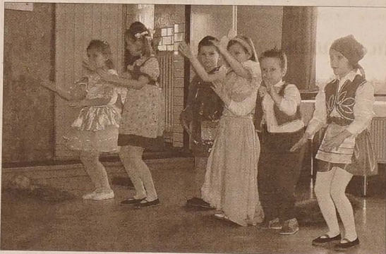
Podziękowanie członkom MK PZKO za całoroczną opiekę złożyły dzieci z frysztackiego przedszkola.

Program i występ chóru „Dźwięk” podporządkowane są zapowiadzanym koncertom „LeWron orchestra” w Pradze, Bratysławie i Warszawie. Kontynuowany będzie remont kapitałowy Domu PZKO.