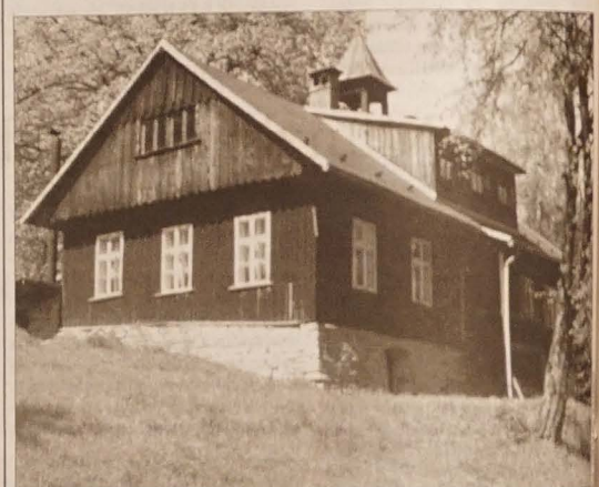
Kiedyś „szkoła na pustkowi”, obecnie ośrodek rekreacyjny Macierzy Szkolnej.

Od wielu tysięcy lat ludzie starali się robić sobie notatki. Pierwszymi takimi „notatkami” można chyba nazwać obrazki, które człowiek prehistoryczny narysował na ścianie jaskini, w której mieszkał. „Zapisał” w ten sposób na przykład opowieść o polowaniu, w którym brał udział.