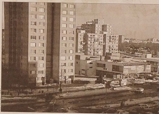
Osiedlowe bloki z wielkiej płyty to niezmiennie podstawowa baza mieszkaniowa dla przeciętnego mieszkańca republiki.

Według informacji pracowników agencji, mieszkańcami najchętniej kupowanymi są M-3 lub M-4 (z niezależnymi pokojami), najlepiej z balkonem i w blokach o niskiej zabudowie. Kupujący najchętniej wybierają mieszkania na parterze i na ostatnich piętrach. Panuje tendencja, że im większe jest