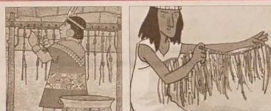
Indiański „pisarz” pisma węzłkowego kipu nie używał pióra tylko sznurków i supełków.