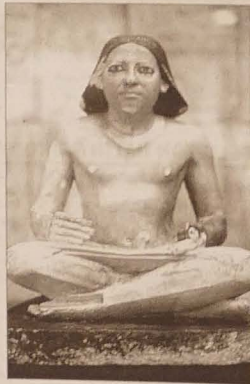
Posażek egipskiego pisarza z czasów faraonów.

Ciekawe jest pismo arabskie. Różni się od tego, którego my używamy, tym, że nie ma w nim samogłosek. Składa się z samych tylko spółgłosek. Za to od ludów arabskich przejęły narody europejskie spo-