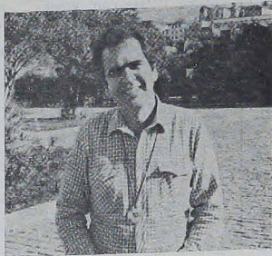
Pela primeira vez em Curitiba, o Pe. Zezinho (foto) realizou seu SHOW-MENSAGEM no Ginásio de Esportes do Taramá no dia 06 de outubro último. Estimava-se que doze mil jovens foram vê-lo. Ele é autor de 45 livros, 54 discos e inúmeros artigos para jornais.