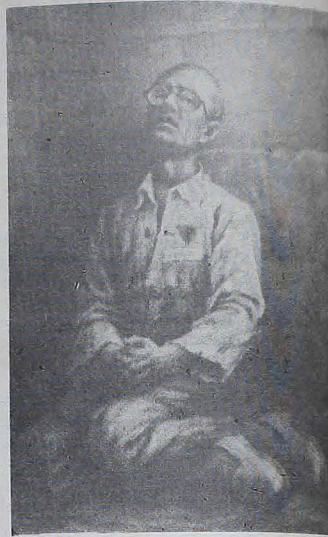
Quadro que retrata o cativo vivido por Kolbe no campo de concentração de Auschwitz.

A 20 de outubro deste ano, vai ser inaugurada, na periferia da cidade de Getúlio Vargas, a igreja de alvenaria, dedicada a São Maximiliano Kolbe, martirizado no campo de concentração de Oswiecim, a 14 de agosto de 1941, e canonizado pelo Papa João Paulo II, no dia 10 de outubro de 1982.