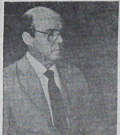
FRANCISCO DORNELLES, minister Skarbu, oświadczył ostatnio, że należy ograniczyć wydatki publiczne do maksimum, by zmniejszyć dług wewnętrzny, wynoszący 50 trylionów kruczeirów.

◆ Brasília — 300 tys. paulistańczyków, 60 tys. w stolicy, 150 tys. w Belo Horizonte i 100 tys. w São João Del Rei zęgnalo trumnę z ciałem Prezydenta Tancredę Neves, która w triumfalnym pochodzie odebrała pośmiertny hołd dla najwybitniejszego obywatela kraju.