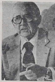
HELIO BELTRÃO, były minister Opieki Społecznej, zrezygnował ze swego stanowiska, nie godząc się na politykę ekonomiczną obecnego rządu. Pozostaje jednak nadal kandydatem na prezydenta państwa licząc na to, że będzie miał poparcie w łonie partii PDS a także wśród partii opozycyjnych. Jest zwolennikiem bezpośrednich wyborów na prezydenta, wówczas bowiem otrzymałby większość głosów wyborców wśród których cieszy się dużą popularnością i zaufaniem.

Nie od dzisiaj opinia publiczna krytykuje przedsiębiorstwa państwowe, które działają ponad stan w wyniku czego ich roczny bilans jest zawsze deficytowy. Funkcjonariusze tych przedsiębiorstw pobierają wysokie pensje, mają różne ułatwienia finansowe, firmy zaciągają pożyczki na własną rękę do tego stopnia, że się wylamyły spod kontroli władz rządowych. Te niedobory przedsiębiorstw państwowych rząd federalny zmuszony jest w ten czy inny sposób wypełnić finansowo. Skąd wziąć na to fundusze? Zwiększa się podatki od prywatnych firm przemysłowych, obarczając je ciężarem trudnym do zniesienia. Nic więc dziwnego, że przez Związek Przedsiębiorstw Prywatnych głośno wyraził swe niezadowolone i sprzeciw z tego powodu. Także większość Kongresu opowiedziała się przeciw przywołaniu i wybrkowi firm państwowych. Rząd federalny nie widział innego wyjścia spod tej presji, jak zarządzić pewne restrykcje w przedsiębiorstwach państwowych, pozostawiając im jednak nadal znaczne ułatwienia i dogodności. Nie należy się więc dziwić temu, że przedsiębiorstwa państwowe nazywane są "nową klasą" brazylijskich burokratów.