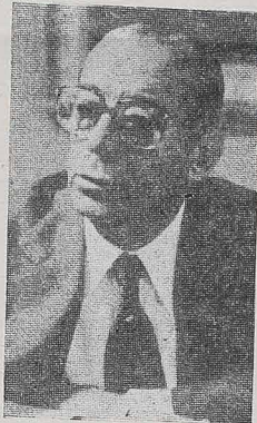
Prezydent FIGUEIREDO, po 7-dniowej wizycie w pięciu republikach afrykańskich, powrócił do Kraju z tym przekonaniem, że jego podróż przyczyni się do wzrostu politycznego prestiżu Brazylii w tym regionie a także zwiększy eksport produktów brazylijskich na drodze wspólnej wymiany.

Prezydent Figueiredo w towarzyszącym mu szefem delegacji, Cesar Cals i generał Ludwigo odbył 7-dniową podróż do Afryki, składając wizyty w Nigerii, dnia 15 listopada, dnia 17 w Bissau, dnia 18 w Senegalu, dnia 19 w Algierii, wreszcie dnia 21 - na Wyspie Solnej, z której wrócił do Archipelagu Zielonego Przylądka.