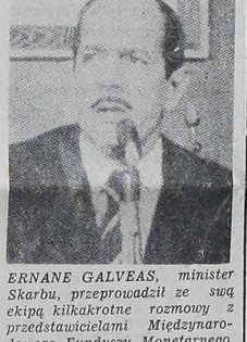
ERNANE GALVEAS, minister Skarbu, przeprowadził ze swą ekipą kilkakrotne rozmowy z przedstawicielami Międzynarodowego Funduszu Monetarnego, stwierdzając, że dzięki przeprowadzeniu ostatnich środków oszczędnościowych w kraju doszło wreszcie do całkowitego porozumienia.

W Amazonii otwartly swo podwoje Bank Amazonii i Bank Brazylijski. Powstała zona wolna od cła w Manaus. Wnet rozpoczęła swą działalność INCRA. Ponadto otwarto cały szereg dróg, by nowi przybywcy z innych stanów mogli wywozić swe produkty.