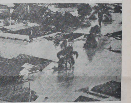
Pomoc ze wszystkich stanów Brazylii dla 300 tys. powodźian w Paranie, Santa Catarina i Rio Grande do Sul dochodzi w nieoczekiwanej skali w postaci odzieży, żywności i lekarstw. Setki tys. ton przewożą samoloty i helikoptery ze względu na przerwanie komunikacji drogowej. Wszelkie instytucje państwowe i prywatne, nie licząc inicjatyw różnych towarzystw i syndykatów, rozwijają żywą kampanię, by dostarczyć miejscowym władcom pomoc pieniężną. Ogromne zaś szkody materialne ocenia się na kilkadziesiąt miliardów kruczeirów. — Zdjęcie: União da Vitória pod wodą.

W konkluzji — amerykańskie instytucje prasowe stwierdzają, że — poza krajami Bloku Wschodniego — w żadnych innych krajach kategoria dziennikarska jest tak trudna i ograniczona jak w większości państw Ameryki Łacińskiej.