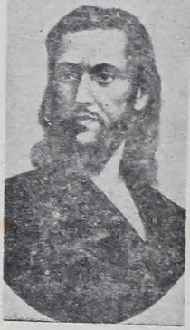
W całej Brazylii obchodzą 21 kwietnia datę bohatera narodowego TIRADENTES (Joaquim José da Silva Xavier), który sędzony na rozkaz władz portugalskich — by ratować swych towarzyszy — wciął całą winę na siebie. Za swą działalność o niepodległość Brazylii (Inconfidência Mineira) został skazany na śmierć przez powieszienie w Rio de Janeiro. Za epokę jego ciało zostało pochowane w główną instytucją na ulicę publiczny przez kilka dni, poczym pochowana w nieznanym aż do dnia dzisiejszego miejscu. Stało się to 21 kwietnia 1792 r.

P. Prezydent wyznał przed narodem, że jego największą troską jest kwestia socjalna i by ją rozwiązać pomyśleć — należy do niej zaprzęgnąć całe społeczeństwo. Wobec zaś nieustającej dyskusji wśród polityków i partii na temat sukcesji na stanowisku prezydenta państwa — Prezydent Figueiredo powiedział dobitnie, że wybory na szeta państwa będą postę-