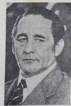
Gen. GARCIA, obecny minister obrony El Salvador i faktyczny rządcą tego kraju, jest mocno krytykowany przez doradców amerykańskich za jego prestrzał metody walki z lewicowymi powstancami. Brak jest jednak innego wpływowego generała, który mógłby objąć to ważne stanowisko.

Władom jest powszechnie, że Stany Zjednoczone udzielają wydatnej pomocy władzom El Salvador w ich walce z komunistycznymi powstancami. Pomoc ta polega na materiale wojennym i znacznych pożyczkach w tym celu, by nie dopuścić do objęcia władzy przez komunistów.