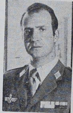
JUAN CARLOS BOURBON, król Hiszpanii, otworzył w Madrycie Konferencję o Bezpieczeństwie i Współpracy Europejskiej, w której udział wzięli 35 państw plus USA i Kanada.

W stolicy Hiszpanii odbyła się Konferencja o Bezpieczeństwie i Współpracy Europejskiej. Najważniejszym punktem tej Konferencji było zadanie państw Wspólnego Rynku Europejskiego i Stanów Zjednoczonych, by wprowadzić na nowo wolność syndykalną w Polsce i zagwarantować prawa człowieka we wszystkich krajach Bloku Zachodniego.