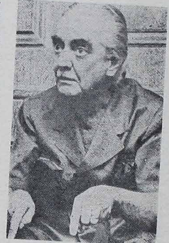
JANIO QUADROS, kandydat na gubernatora São Paulo z ramienia partii PTB, jest również przekonany, że małe partie opozycyjne nie mają przed sobą dalszej pewnej egzystencji, ponieważ nie będzie rzeczą łatwą uzyskać w wyborach 5 procent deputowanych pochodzących z różnych stanów Kraju.

Różni senatorowie i deputowani federalni, bez względu na swą przynależność partyjną, są przekonani, że listopada wybory będą praktycznie rozgrywane jedynie między partiami PDS i PMDB. Posiadają bowiem one dyktatoria i kandydatów we wszystkich stanach Kraju, czego nie mają na powiadzenie o innych partiach opozycyjnych. Jedynie w Rio de Janeiro partia PTB jest na razie górą z Brizolą na czele.