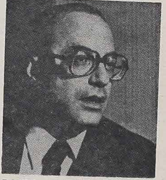
PAULO MALUF, Gubernator stanu paulistąńskiego, popiera akcję swej małżonki, by ustanowić w tym stanie centra kontrolujące planowanie rodziny.