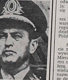
Gen. WALTER PIRES, Minister Wojska, w rozkazie dziennym wydanym do jednostek trzech broni, z okazji 18 rocznicy Rewolucji Marcowej wyraził życzenie, by data ta obchodzona była nie tylko przez jednostki 4-ech Armii, lecz także przez całe społeczeństwo, zwłaszcza przez młodzież. Rewolucja Marcowa bowiem uratowała Kraj od objęcia władzy w państwie przez komunistów.

Minister Wojska gen. Walter Pires wydał do jednostek trzech broni rozkaz dzienny z okazji 18 rocznicy Rewolucji Marcowej. P. Minister przytoczył liczne zaskia, które towarzyszyły wydarzeniom 31 marca 1964 r., a które groziły opaniem władzy w Kraju przez komunistów. W rozkazie prezydenta João Goularta. Komuniści chwaliли się tym, że obejmą władzę bez oddania jednego wystrzału. I dzisiaj nie brak elementów, którzy idą ich śladem, zapominając, że Armia Brazylijska zawsze czuwała nad ładem, spokojem i bezpieczeństwem Ojczyzny; że Armia nie dopuścił, by powtórzyły się wypadki dywersji i bezbożności jakie miały miejsce przed wybuchem Rewolucji Marcowej. W obronie Konstytucji, demokracji i bezpieczeństwa państwa Armia Brazylijska stoi na straży i pragnie zjednoczyć się z całym narodem. Dlatego Rewolucja Marcowa powinna się obchodzić nie tylko w garnizonach wojskowych, lecz także w różnych instytucjach cywilnych. 31 marca 1964 roku jest datą, która zostanie w historii, której nigdy nie można zapomnieć. Młodzież zwłaszcza powinna o niej pamiętać, bo od tej daty rozpoczął się wielki zwrot ku wielkiemu rozwojowi Kraju, który postawił Brazylię na oczach całego świata.