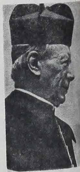
Dom Stefan Wyszynski