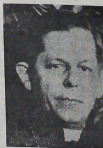
Dom Josef Glomp

Sua nomeação para arcebispo de Varsóvia e primaz da Polónia, indica provavelmente que, de agora em diante, os cargos de primaz e arcebispo da Conferência Episcopal Polonesa — nomeado em 1978 — serão sempre desempenhados pelo cardeal Franciszek Macharski, arcebispo de Cracóvia, que assumirá a presidência da Conferência Episcopal Polonesa, qual era secretário-geral até agora.