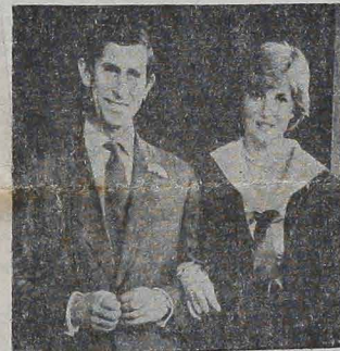
Kilka tysięcy zaproszonych gości wzięło udział w największym ślubie XX wieku, podczas gdy 750 milionów osób oglądało to historyczne wydarzenie przez telewizję. Podróż pokładową spędzają nowożeńcy na jachcie po Morzu Śródziemnym. Na zdjęciu książkę KAROL i lady DIANA na kilka dni przed ślubem.

propozycje USA odnośnie kontroli zbrojeń opierają się na strategii i obronie własnego kraju; żywotnym interesem USA jest ograniczyć zbrojenia do tego stopnia, by ich użycie było mało prawdopodobne; USA nie mogą dopuścić do tego, by ich słabość militarna była podjęta do ataku sowieckiego; Ameryka podpisze jedynie takie porozumienie odnośnie ograniczeń zbrojeń, jeżeli będzie miała zagwarantowaną ich kontrolę; wszystkim amerykańskim rodzajom broni muszą odpowiadać odnośnie broni sowieckiej, gdyż tylko w ten sposób powstrzymamy się Rosję przed użyciem swej siły militarnej.