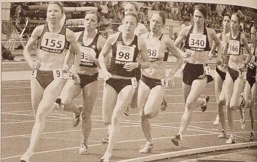
Bieg kobiet na 1500 m.

dek, który wciąż nie rezygnuje ze startu na czempionacie w Osace. - O ile dopisze mi zdrowie, chciałbym swoją karierę sportową zakończyć na igrzyskach olimpijskich w Pekinie - dodał