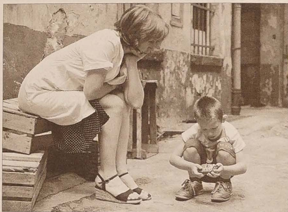
Wśród wyświetlanych w tegorocznej edycji filmów fabularnych znajdzie się m.in. Co słono widział Michała Rosy.

Wakacyjne Kadry w ubiegłym roku trwały 4 dni i odnotowałyśmy blisko 20 000 wejść na wszystkie seanse, a w tym roku festiwal trwa 9 dni – od 7 do 15 lipca. Jest widocznie wydłużony czas trwania i dwie nowe kategorie konkursowe, jakimi będą polskie seriale telewizyjne i Europejski Festiwal Programów Telewizji Lokalnych, w którym bierze również udział „Kabelová televize Trinec”.