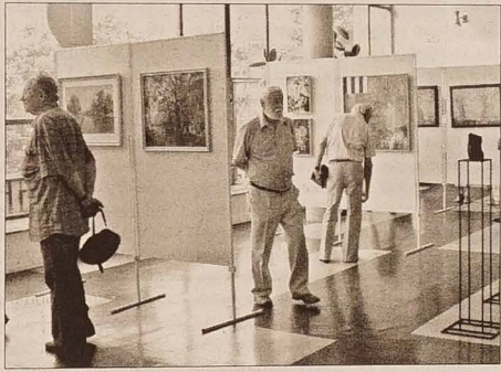
W Wielkiej Galerii obejrzyć możemy, obok malarstwa i rzeźby, ceramikę.