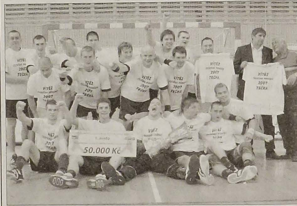
Karwina z Pucharem RC.

KARWINA - ZUBRZY 35:19 (16:7). Karwina: Marjanovič - Bednarík 5, Plšek 2, Kuzo 4, Indjič 1, Zdráhal 6/3, Šulc 2, Mrožek, Bajgar 2, Szymon 1, Kubis 2, Korňan 5, Rachač 3. (ib)