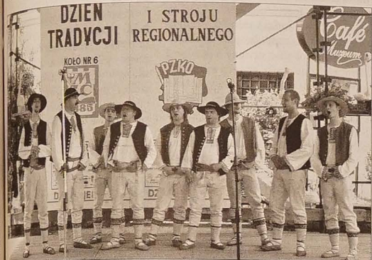
W niedzielę wystąpiły zespoły, chóry i kapela z obu stron Olzy. Największe oklaski zebrał zespół „Oldrzychowice”.

By lepiej poznać przemiany miasta Karwiny, warto obejrzyć w Galerii Zamkowej niewielką prezentację starych zdjęć i pocztówek pozwalającą konfrontować owe przemiany z dziełami plastyków. (o)