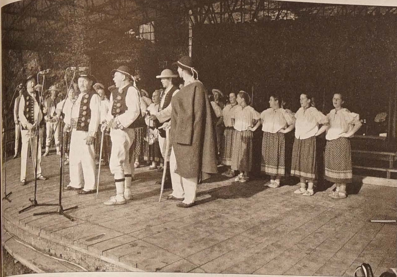
Wieloletnie zyczenie widzowi 54. Dnia Oszeldy ZPIT „Istebna” oraz ZP „Gronie” wykonali „Szumi jawor, szumi”.

tel.: 558 731 766 faks: 558 740 044 info@glosludu.cz