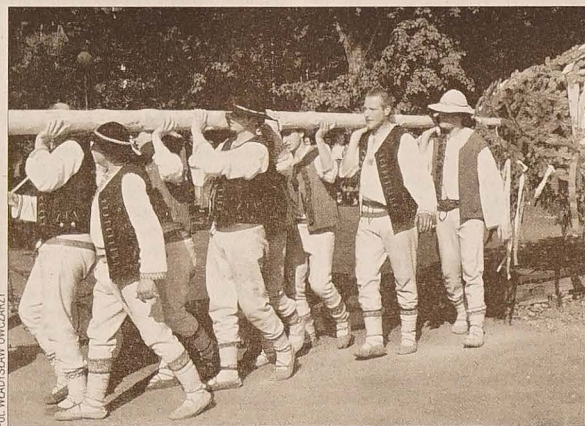
W niedzielę, w pięknej pogodzie odbył się w Parku Zdrojowym w Darkowie ostatni koncert tegoroczny „Maja nad Olzą”. Brawami nagradzali widzowie muzyków karwińskiej orkiestry „Mała czarna hudba” oraz zespół „Oldrzychowice”. Jego męska część (na zdjęciu) na zakończenie „zbulat moja” zdobył przez pięć niedziel podium uzdrowska.

Targi IWIS to jedyna w Polsce impreza tego typu o międzynarodowym zasięgu, ma kilkuletnią tradycję i dobre imię w świecie. Do tej pory odbywała się w Gdańsku, jednak w br. przeniosła się do stolicy. Swoją dorobek innowacyjnej, przedstawiającej wynalazcy z Chin, Chorwacji, Francji, Litwy, Malezji, Tajwanu, Węgier, RC i z Polski. Czeskie Towarzystwo Hutnicze jako tradycyjnie należy do jej uczestników, uzyskując sporo odznaczeń – np. w 2005 r. trzyniecscy racjonalizatorzy zdobyli tu Grand Prix.