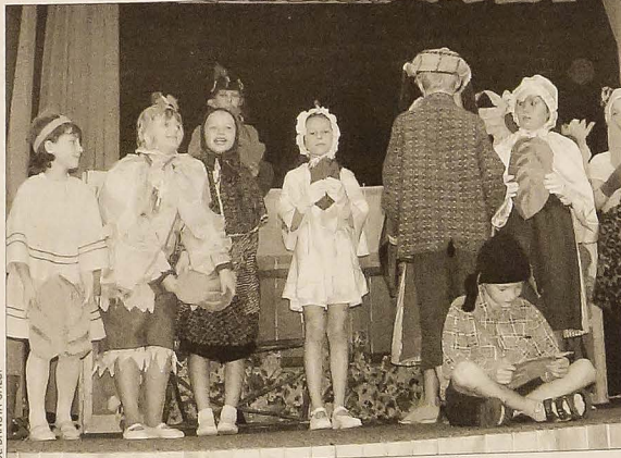
Spektakl zakończył się wspólnie „po zwierzęcu” odśpiewaną piosenką dla mam.

Niesygnowane materiały publicystyczne i informacyjne pochodzą z internetowych serwisów informacyjnych.