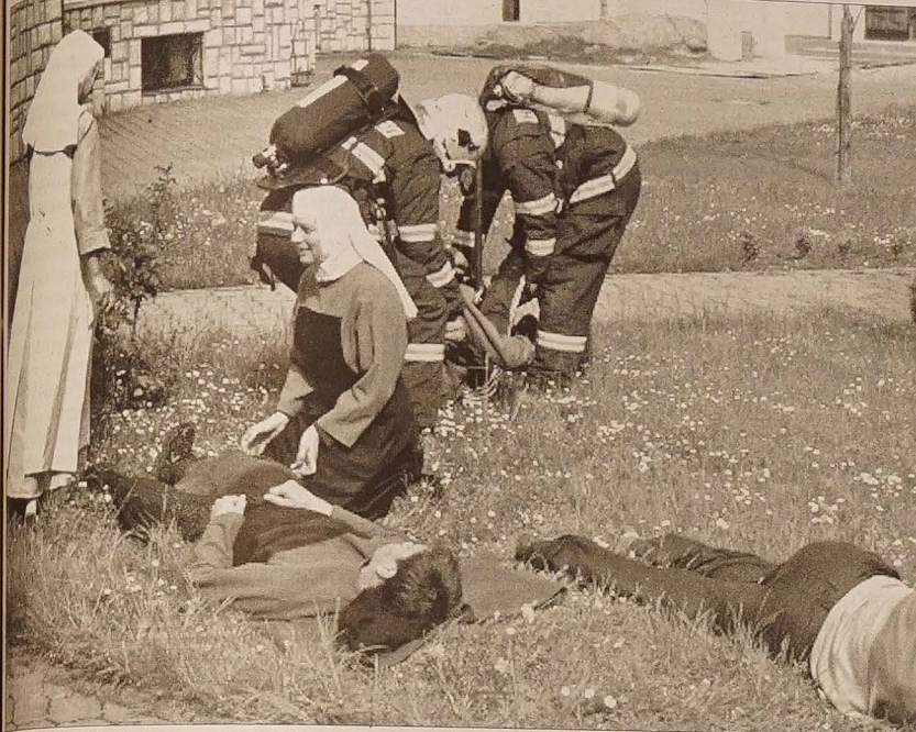
W klasztorze dziewczynki siostry elżbietanki utworzyły punkt pierwszej pomocy medycznej, w którym – jak ocenili strażacy – fachowo udzielają pomocy.

tel.: 558 731 766 faks: 558 740 044 info@glosludu.cz