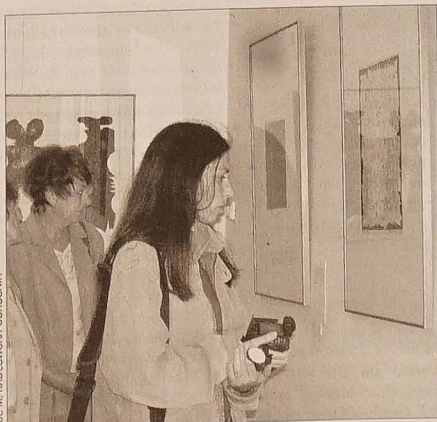
Dzieła Eduarda Ovčáčka nawet po 40 latach robią na publiczności duże wrażenie swoim ujęciem abstrakcji.

Wystawa będzie czynna do 4 sierpnia br. codziennie w godz. 10-13 i 13.30-18.