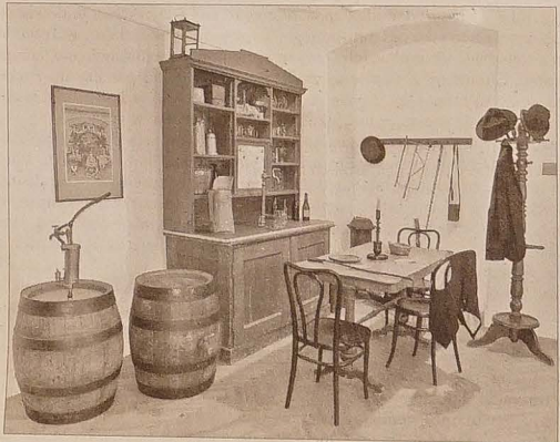
Fragment ekspozycji – jeden wzynek przypadał w Morawskiej Ostrawie na 100 mieszkańców.

Wszystkim, którzy znajdą się na ostrawskim rynku, polecam zwiedzenie tej niezwykłej pozycji. Nie tylko przez wzgląd na cisnącą „renomę” ulicy Stodolni, nie tylko ze względu na poznanie obyczajowości społecznej, ale przede wszystkim z ciekawości, że tworzyły przeszłość stuleci (w którym to czasie, dżdżymy, przetrwały w Ostrawie i Dom Polski, rodzaje Morawskiej Ostrawy, społeczne, narodowościowe ruchy polityczne, społeczne, narodowościowe epokowym znaczeniu, ale też ze względu na bezniezmierności grzesznej duszy ludzkiej, bez której nigdy nie byłoby... grzeszenie Ostrawy. MARTYNA RADLOWSKA-OBRZĘDA