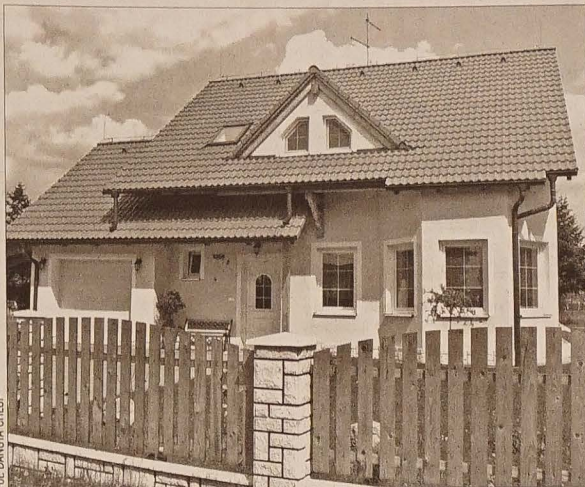
We wszystkich miejscowościach Zaolzia widać nowe domy.

Głównym powodem budowy domu bywa pragnienie spokojnego życia z dala od hałasu miejskiego oraz korzystanie z dobrodziejstw własnego