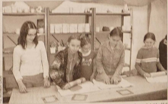
Podczas Dnia Otwartego w Jabłonkowskiej PSP im. Henryka Sienkiewicza piątkoaklasiści z okolicznych gmin mogli wziąć udział w zorganizowanych dla nich zajęciach, m.in. w pracowni ceramicznej.

■ Aż 21 telewizorów 80-calowych znanej firmy zniknęło z tira, który w czwartek przekroczył polsko-czeską granicę w Cieszyne Boguszowicach. Romanowski kierowca zaparkował pojazdy i położył się spać w kabinie. Gdy spał, złodzieje ukradli telewizory, które przewoził. Każdy telewizor mógł być wart około 3,5 tysiąca złotych. Prawdopodobnie sprawcy monitorowali pojazd i wiedzieli, co się w nim znajduje. Ops. (kor)