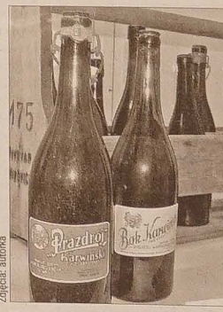
Ulubione marki piw pite w Ostrawie z opawskiego i karwińskiego browaru hr. Larischa. Podobno karwiński „Przdroj”, jasny i pełny, miał niezapomniany smak...