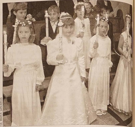
Do pierwszej komunii dzieci przystępują odświętnie ubrane. Zapalone świece symbolizują światło Chrystusa.

Ważne znaczenie podczas uroczystości komunijnej ma świeca, symbolizująca światło Chrystusa. Tak jak podczas chrztu rodzice i chrześni wierzeli się zła i wyznawali wiary, przy zapalanej świecy, dziecko samo już odnawia ten ślub. Dlatego jest przez