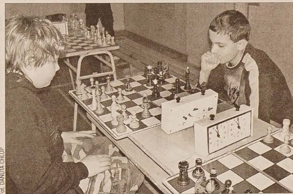
Jedną z dyscyplin turnieju „IQ-TyQ” były popularne szachy błyskawiczne.

Pod koniec zebrania ustalono, że Zarząd Główny będzie się spotykał teraz co miesiąc. Konwent Prezesów postanowiono zwołać na 12 kwietnia br. do sali przy ul. Bożka.