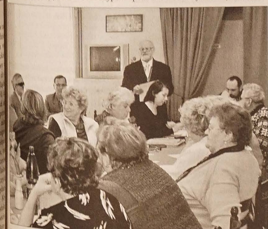
Na zebranie przybyła też delegacja partnerskiej organizacji z Wodzisławia.

Nie wszystkie jednak akcje spotykały się z zainteresowaniem. Przypomniano choćby zainicjowaną na-