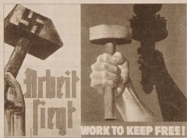
Plakaty: niemiecki Hermanna Graha „Praca zwycięży” (1935) i amerykański „Pracuj, by utrzymać wolność!” (1943)

Kilka miesięcy później ruszył państwotwórczy program prac publicznych, w którym uczestniczyło 3 700 artystów. Na berlińskiej wystawie można obejrzeć szkice kilku fresków. Od stalinowskiego socrealizmu odróżnia je tylko bardziej awangardowy