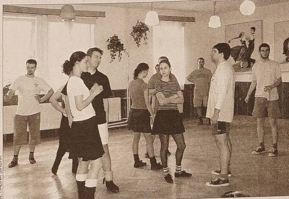
„Olza” szlifuje swój program.

Niesygnowane materiały publicystyczne i informacyjne pochodzą z internetowych serwisów informacyjnych.