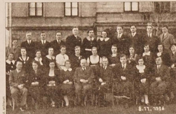
Chór mieszany Związku Ewangelickiej Młodzieży w Nawsiu.

Trudności w pracy zespołów chórnych były wielkie. Najdotkliwiej dawał się odczuwać brak materiału nutowego. Dyrygenci byli zmuszeni własnoręcznie przepisywać głosy chórne lub powielać je prymitywnym sposobem na żelatynie czy masie hektograficznej. Brak było też często zrozumienia w społeczeństwie, szczególnie u rodziców, którzy zabraniali swoim synom i córkom chodzenia do „jakichś kumedyjantów”. Dyrygenci jednak nie zrażali się tymi trudnościami i dzielnie kontynuowali pionierskie dzieło. Owoce nie dały na siebie długo czekać. Te „nowości” zaczęły się ludziom podobać, zaczęło przybywać coraz więcej ochoty, szeregi śpiewactwa zaczęły się poszerzać.