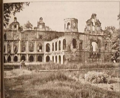
renesansowego zamku w Tworkowie, dawniej rezydencji rodziny Rybnikowskich, a później Włeczów, wzniesionej prawdopodobnie w 2. poł. XVI wieku na fundamentach zamku średniowiecznego.

Za sprawą Internetu można zapoznać się z „nieznanym” nam Śląskiem od biurka, można też, korzystając z dobrodziejstw wiosennej aury, wsiąść na rower i przecierać samodzielnie śląskie ścieżki, które w minionym reżimie zatarto w naszej świadomości barierą granicy. (mro)