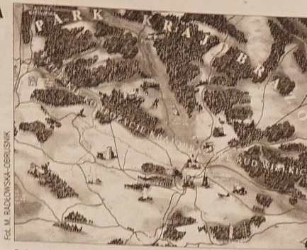
Subregion Zachodni na mapie. Od Zaolzia najdalej... godzinę drogi.

Raj dla żeglarzy może być też rajem dla rowerzystów,