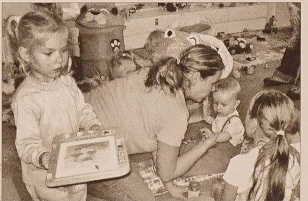
W czasie, gdy mamy wymieniają się doświadczeniami, maluchy bawią się w sali pełnej zabawek.