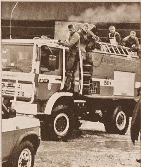
Powstanie wspólnego ośrodka ratowniczego mogłoby usprawnić działania polskich i czeskich strażaków.

Budynek „Strzelnicy” został wzniesiony w 1882 r. i jest objęty ochroną zabytkową.