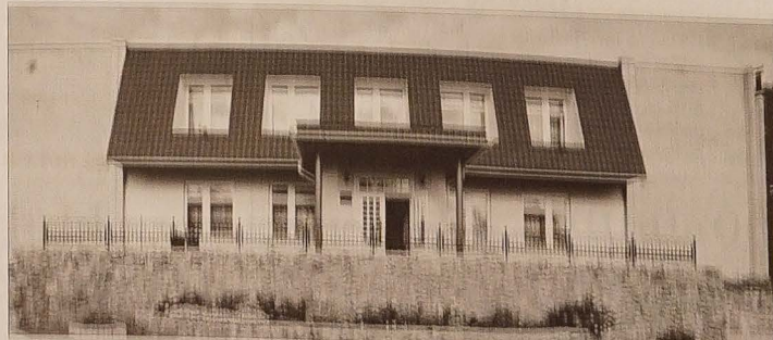
Poliska szkoła w Rezekne.

Poliska szkoła w Rezekne brała też wielokrotnie udział w licznych projektach, takich jak Funduszu Sorosa „Efektywna szkoła”, „Jakość w pracy” oraz krajowy nadbaltyjski „Blend-a-mod”. Nauczyciele z Rezekne posiadają też dobrą informację nt. kursów doskonalenia zawodowego, które odpowiadają ich zainteresowaniom.