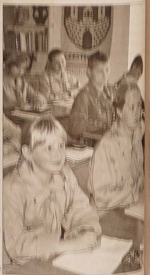
Na lekcji języka polskiego.

Wszyscy uczniowie biorą udział w miejscowych olimpiadach wiedzy, zajmując w nich wyłącznie pierwsze i drugie miejsca, także na przeglądach zespołów. Rezekneński folklorystyczny zespół szkolny propaguje folklor polski i łotewski.