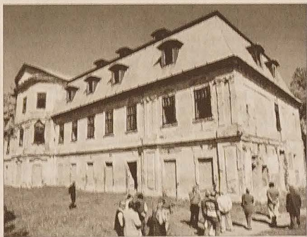
Obecny stan pałacu Platerów.

W kościele parafialnym, w ołtarzu głównym, znajduje się dzisiaj nadal wspaniałe dzieło Jana Matejki przedstawiające św. Ludwika, patrona kościoła, uczestniczącego w wyprawach krzyżowych do Ziemi Świętej. Obraz uchyla wielokrotnie okłapniętą stronę polską, proponując w zamian nawet budowę nowego kościoła. Łotysze z oferty jednak nie skorzystali. Krasławski kościół jest też w posiadaniu relikwii św. Donata sprowadzonych dzięki staraniom Platerów z katakumb Ziemi Świętej.