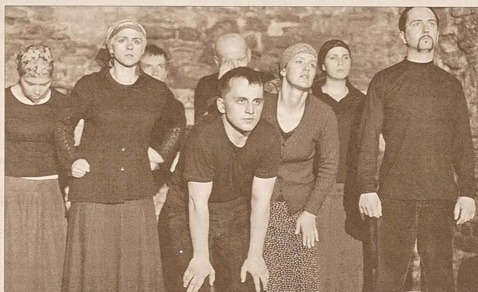
Spektakl „Kavkazkij priwlet” Cieszyńskiego Studia Teatralnego.