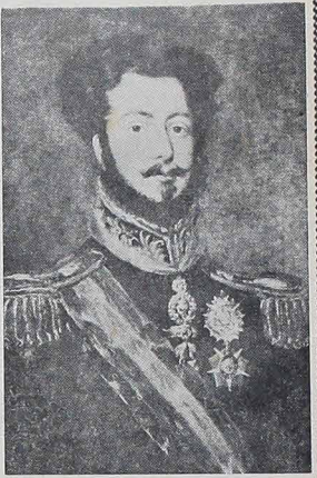
Cesars D. PEDRO I

Co roku Narod brazylijski obchodzi uroczyste Święto Niepodległości dnia 7 września. Bohaterem tego epokowego wydarzenia był książę Piotr, późniejszy I cesarz Brazylii pod nazwą D. Pedro I. Jego rodzicem był Dom Pedro de Alcantara Francisco Antonio João Carlos Xavier de Paula Miguel Rafael Joaquim José Gonzaga Pascoal Cipriano Serafim de Bragança e Bourbon. Urodził się w Portugalii w 1798 roku i był czwartym synem króla Jana VI i D. Carlota Joaquina.