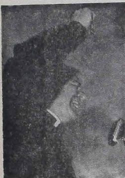
A Congregação para o Clero divulgou documento com Normas para melhor distribuição do clero.

A formação de sacerdotes e sua distribuição pelas paróquias para continuarem a obra evangelizadora e santificadora de Cristo sempre foi uma das preocupações da Igreja. Prova disto são os numerosos documentos divulgados pelos papas mostrando a necessi-