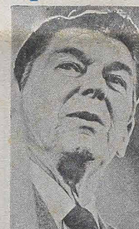
RONALD REAGAN, należący do Partii Republikańskiej, może stać się groźnym rywalem prezydenta Cartera w tegorocznych wyborach na szefa państwa. Reagan wykazuje wszelkie błędy Cartera tak w polityce wewnętrznej jak i zagranicznej.

Głównymi sloganami Reagana w kampanii wyborczej są takie problemy jak: asystencja sanitarna, powinna należeć do państwa, a nie do prywatnych przedsiębiorstw; należy koniecznie zrównoważyć bilans handlowy (import z eksportem), co było i jest przyczyną inflacji i kraju; zredukowanie choćby częściowo podatków oraz zwiększenie autonomii administracyjnej dla poszczególnych stanów; Kanał Panamski nie powinno się oddać władzom Panamy przed ukończeniem terminu, który