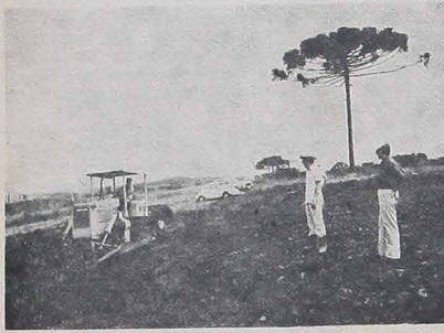
Aqui o local do Seminário Vicentino de Filosofia.

Após vários meses de tramitação por cartórios e pela Prefeitura foi, enfim, conseguida a liberação definitiva para o início da construção do novo seminário vicentino.