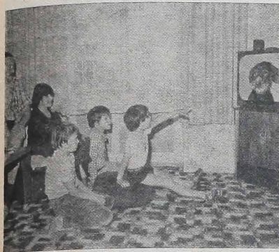
Hoje, a família praticamente não pode assistir de uma forma tranquila programas de Televisão, pois, é aturda por cenas de imoralidade e violência que vão bem acima dos limites.

Ibrahim Abi-Ackel, ministro da Justiça, usará a censura para reduzir as cenas de sexo e violência na televisão e evitar a utilização de "linguagem chula" ou a ridicularização de pessoas de cor e deficientes físicos em programas de televisão, caso as próprias emissoras não tomem iniciativa nesse sentido. "Nós estamos buscando o diálogo para não usarmos a tesoura", afirmou Abi-Ackel, ao demonstrar sua intenção, negando, no entanto, que estivesse fazendo ameaças: "Não é uma ameaça, é uma colocação. Ameaçar, você ameaça quando não dá opção. Quero o diálogo para não usar a tesoura".