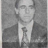
IBRAHIM ABI-ACKEL, minister Sprawiedliwości, jest obrońcą przeprowadzenia wyborów municypalnych w roku bieżącym. W sprawie tych wyborów wypowiedział się p. Prezydent, oświadczając, że Kongres ma zdecydować o ich realizacji.

Władze federalne mając zapewnić większość w Senacie, miałyby być zadowolone. Deputowanych mogą uzyskać w Kongresie tak czy nie odnośnie tegorocznych wyborów municypalnych.